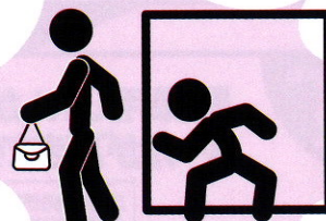
チカン・わいせつ事件