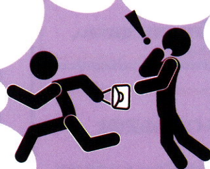
ひったくり・路上強盗